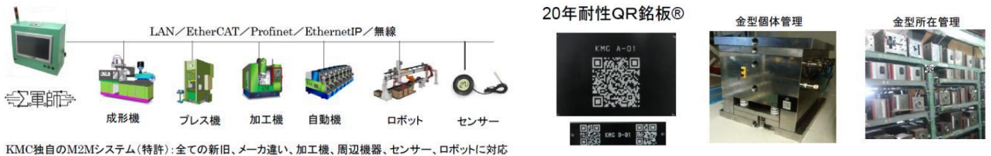
KMC独自のM2Mシステム(特許): 全ての新旧、メーカー違い、加工機、周辺機器、センサー、ロボットに対応

(メーカー違い、古い設備等にも対応可能な M2M システム／錆びない、剥がれない、高耐熱、20年耐性金属用 QR)